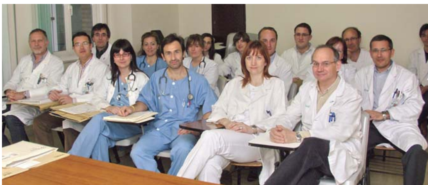
Reunión semanal de los participantes en el Proceso de CCR.

Una de esas áreas es el paso de Atención Primaria a Especializada y para ello es preciso seleccionar a los enfermos con mayor riesgo de sufrir CCR entre todos los que ve el médico de familia. Puesto que los síntomas de un paciente con CCR son muy comunes (rectorragia, estreñimiento, diarrea, etc.), no es posible priorizar a todos ellos para la colonoscopia. Deben discriminarse a los que realmente están en riesgo de CCR y en ello se ha trabajado. “Los médicos de familia tienen un programa de gestión de Historia Clí-