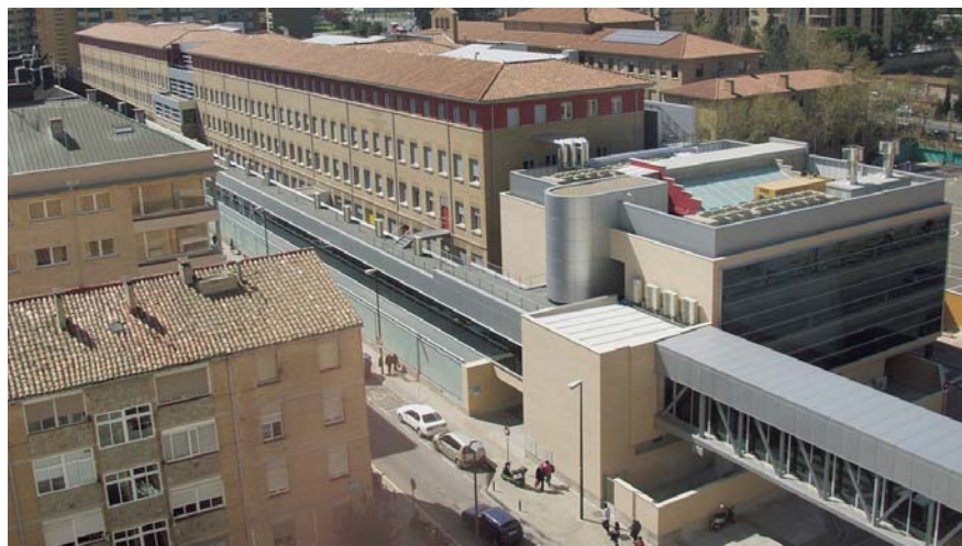
Edificio de Consultas Externas.

Por otra parte el pasado mes de enero en esta misma sección informábamos de la implementación de una sugerencia que proponía el envío de petición de certificados al Servicio de Personal, a través de la intranet ,