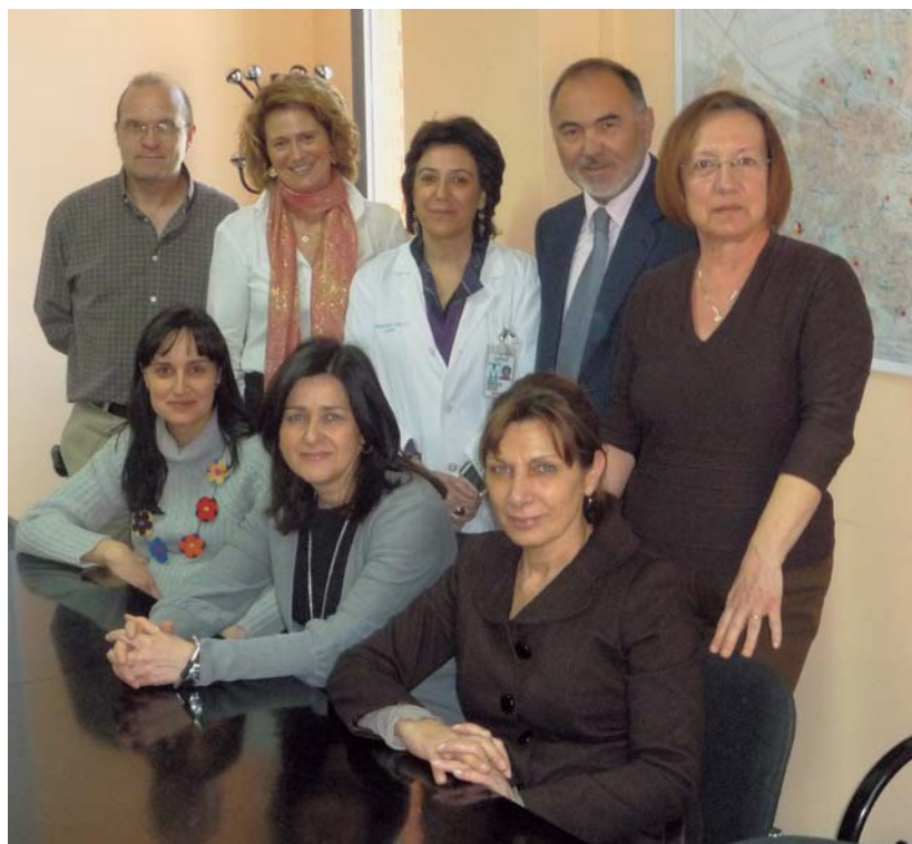
Grupo de organización de Fisioterapia en Rehabilitación del Sector Zaragoza II.

El objetivo es conseguir un uso óptimo y racional de los recursos, con el horizonte de un usuario mejor atendido y una comunicación óptima entre los profesionales.