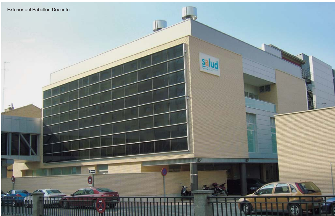
Exterior del Pabellón Docente.

Las actividades más numerosas durante el año pasado fueron las relacionadas con la formación continuada.